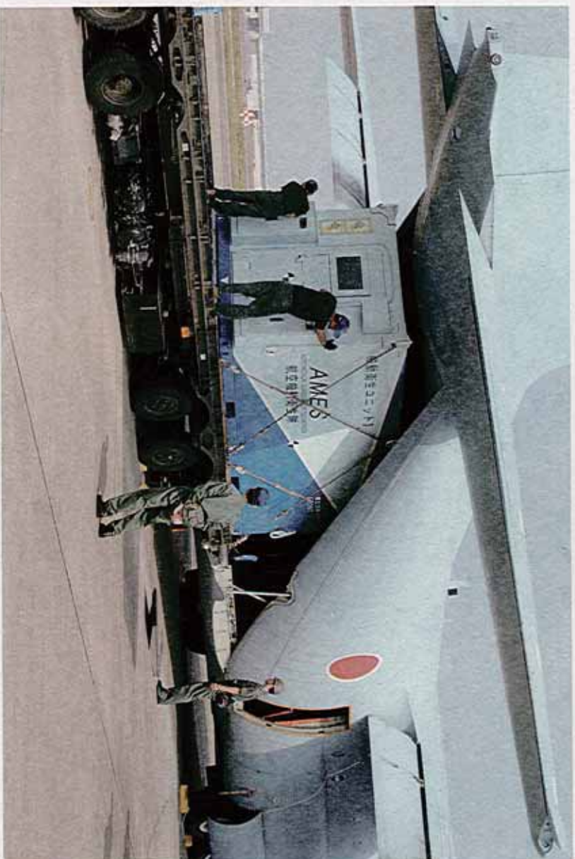
航空機整備生協「機中整備ユニット」