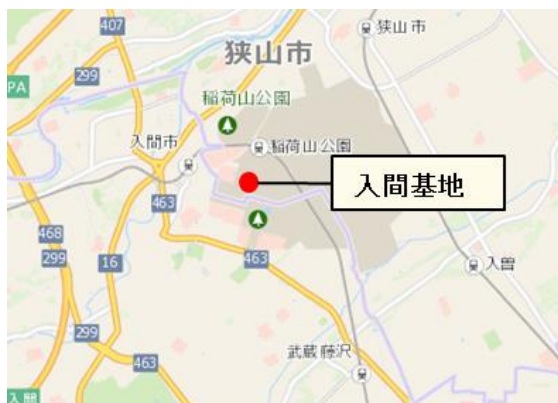
「入間基地」施設整備

を実施予定であり、これらを含め入間基地における施設整備に係る経費として全体で約166億円を計上しています。