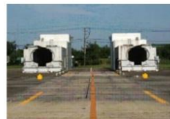
輸送機（C-2）受入施設 （消音装置）